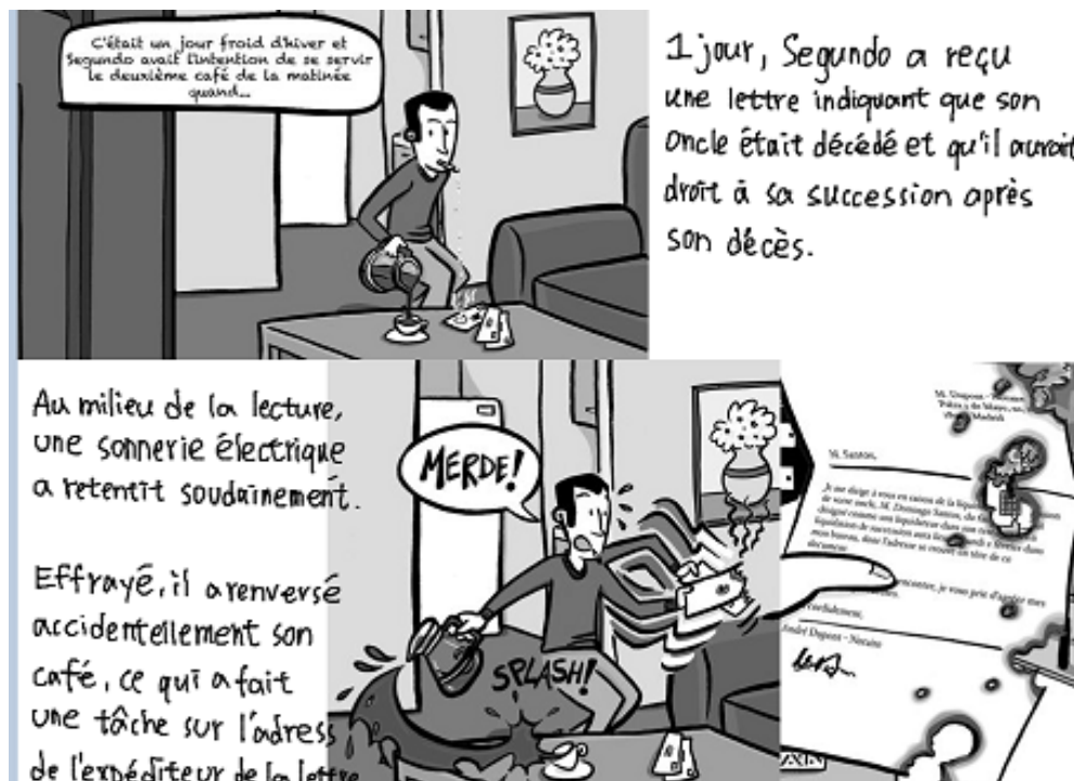
Figure 2. Extrait du récit Héritage mystérieux

(2020), « les sémiotiques linguistiques d'une part et iconique d'autre part n'ont pas, par définition, les mêmes potentialités » (paragr. 80). C'est ainsi que leur collaboration peut, d'un effet synergique, contribuer à la construction sémantique du récit. Bien qu'il existe un aspect redondant dans les informations offertes par les deux modes, leur spécificité et complémentarité permettent de présenter une scène tangible, et d'augmenter ainsi la lisibilité du texte.