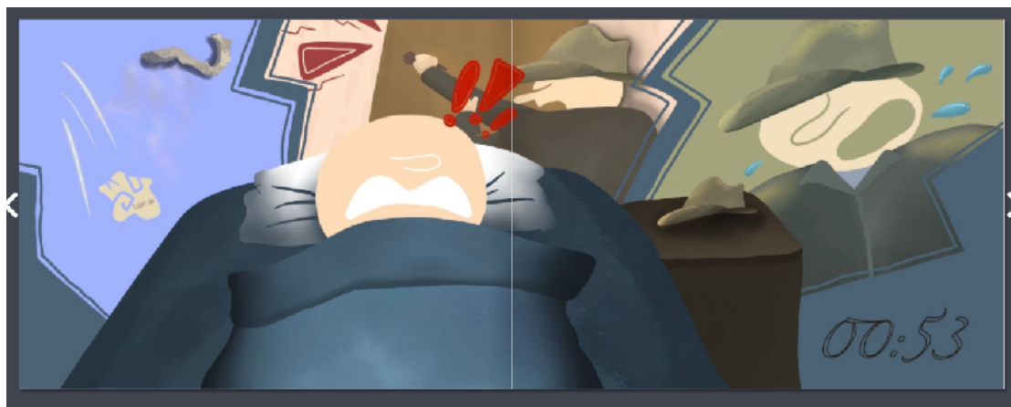
Figure 6. Extrait d'une double page de Le mystère du temps

Dans cette configuration, l'œil du lecteur est guidé par la composition directionnelle de la gauche vers la droite, c'est-à-dire de l'image de l'immeuble au texte descriptif. En disposant des éléments textuels et iconiques de cette manière, l'étendue horizontale crée une force déployée grâce au décloisonnement de pages et à l'alternance de textes et d'images en continuum. À ce cela s'ajoute l'expression du mouvement continu dans une progression temporelle (voir figure 6).