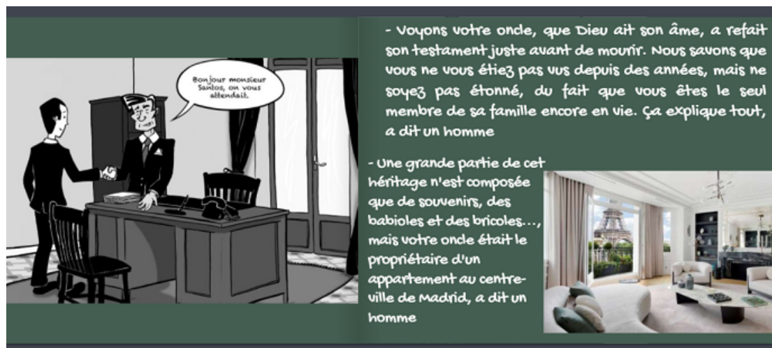
Figure 3. Extrait d'une double page de Deuxième chance

D'après Van der Linden, pour assurer une cohérence interne de l'œuvre, les images associées devraient être reliées non seulement par leur enchaînement spatial, mais aussi par une cohérence sémantique ou une continuité plastique (2003, p. 65). Pourtant dans notre récit en question, le problème de continuité plastique (couleur, forme, texture du signe visuel) 3 se double à celui de cohérence sémantique – l'appartement devrait se situer au centre de Madrid (indiqué dans le texte), alors que la photo montre un salon avec la vue sur la Tour Eiffel. En analysant la relation texte-image dans les doubles pages de l'album, Leclaire-Halté (2014) parle de la « fonction proleptique » de l'image dans l'anticipation du déroulement du texte. C'est-à-dire, la vision immédiate et simultanée que représente l'image attire l'attention du lecteur dans un premier temps en orientant son horizon d'attente. Les interférences préjudiciables entre image et texte troubleraient la compréhension du lecteur lors de sa réception. Il est possible que cette rupture sémantique vienne de la négligence de l'étudiant-créateur, ou de difficultés à trouver des images correspondantes.