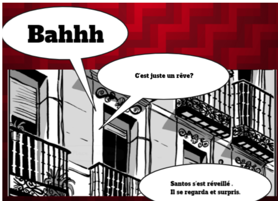
Figure 4. Extrait de Double chance

Puisqu'il est impossible de puiser dans l'œuvre source des images illustrant l'action du protagoniste, ici, le réveil, l'étudiant-scripteur recourt au discours verbal pour combler le vide des informations manquantes. Il est manifeste que les discours verbaux ne sont pas disposés à côté de leurs images correspondantes, mais présentés dans des bulles bédéiques. Dans cette configuration de la page-écran, le message iconique ne suffit pas à se faire comprendre, mais nécessite un discours verbal sans lequel le lecteur ne saurait comprendre ce qui se passe dans l'appartement. Mais c'est grâce à ce rapport coconstructif que s'engendre une unité sémantique dans une expression globale.