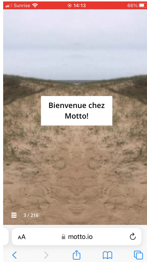
Figure 2. Capture d'écran de la page d'accueil, www.motto.io

caméra de son téléphone intelligent et de filmer ce qu'il y a autour de soi : l'œuvre emprunte au documentaire et à la fiction, construisant le fil de l'intrigue grâce aux séquences du public. Les captations vidéo durent deux secondes et sont intégrées à une banque de données qui sont récupérées par le logiciel et jouées tout au long de l'histoire.